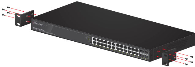
Fastening the brackets on the Switch