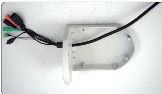
7 Fix the WMK-600 body to the wall.