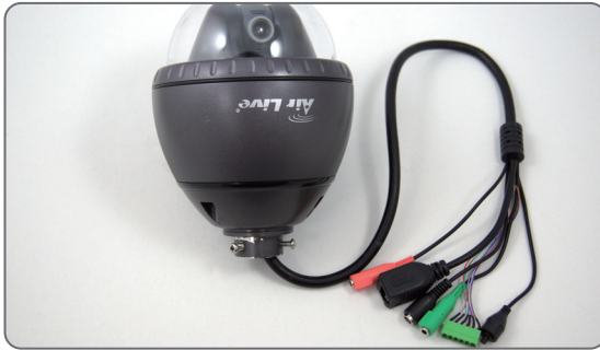
1 Get IP Camera body from the package.