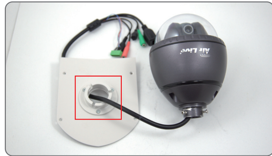
4 Make the cable go through the hole of top casing as shown in the picture.