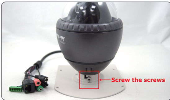
5 Screw the screws of OD-600HD for fixing it to the top casing.