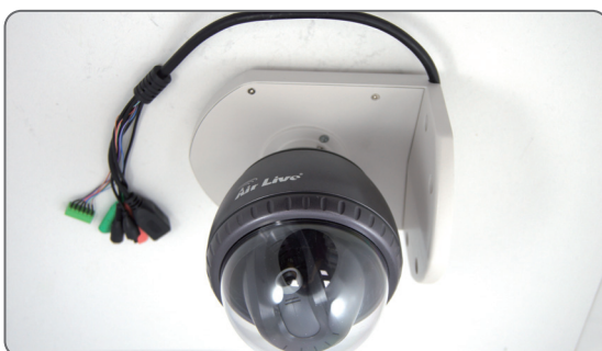
9 Fixture complete