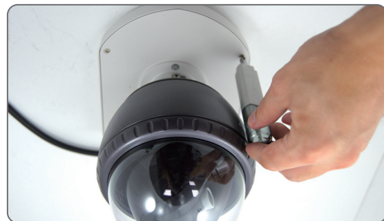
8 Assembly the top casing to the WMK-600 body.