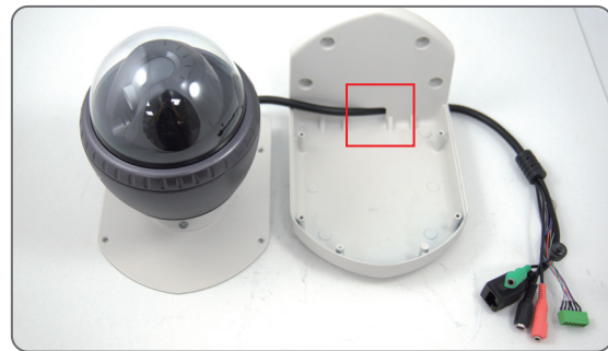
6 Make the Cable go through the hole of WMK-600 body.